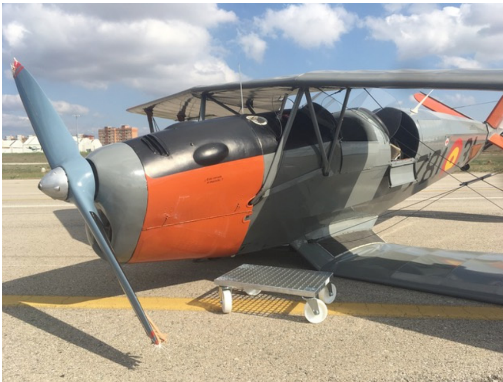
Figura 1. Aeronave tras el accidente