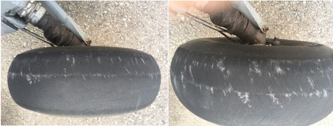
Figura 5. Marcas en neumáticos

Se comprobó que había continuidad de todos los mandos de vuelo.