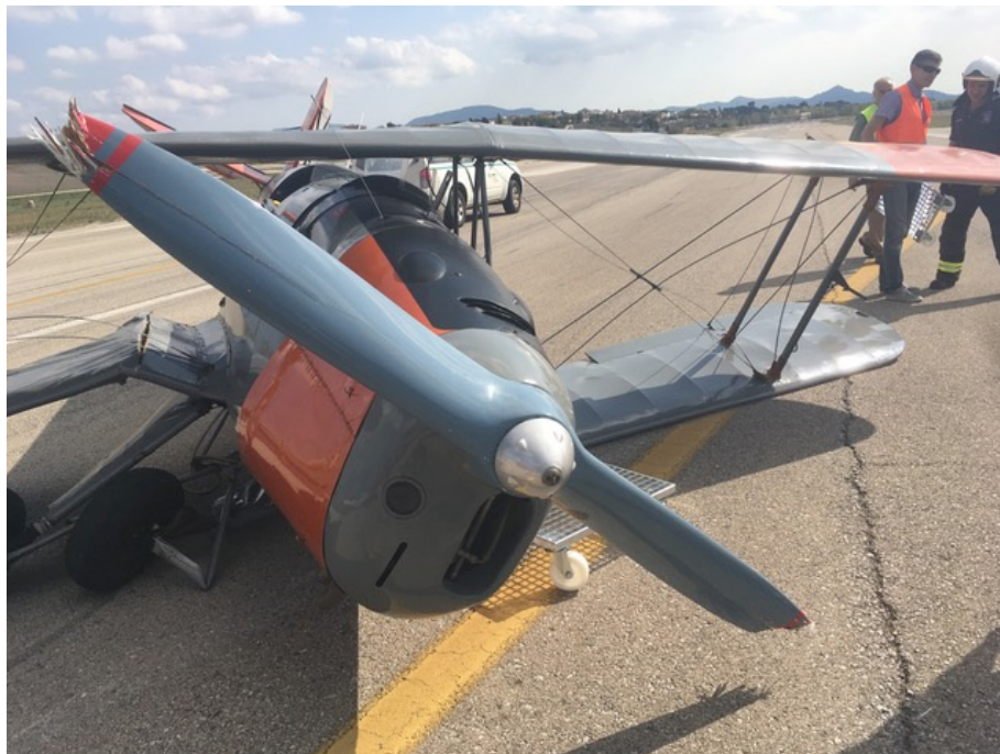
Figura 4. Estado de la aeronave tras el accidente

Se observó que colapsaron hacia la derecha ambas patas del tren de aterrizaje, así como que se produjeron daños en las puntas de las palas debido al impacto de la hélice con la pista, tal y como puede apreciarse en la Figura 4.