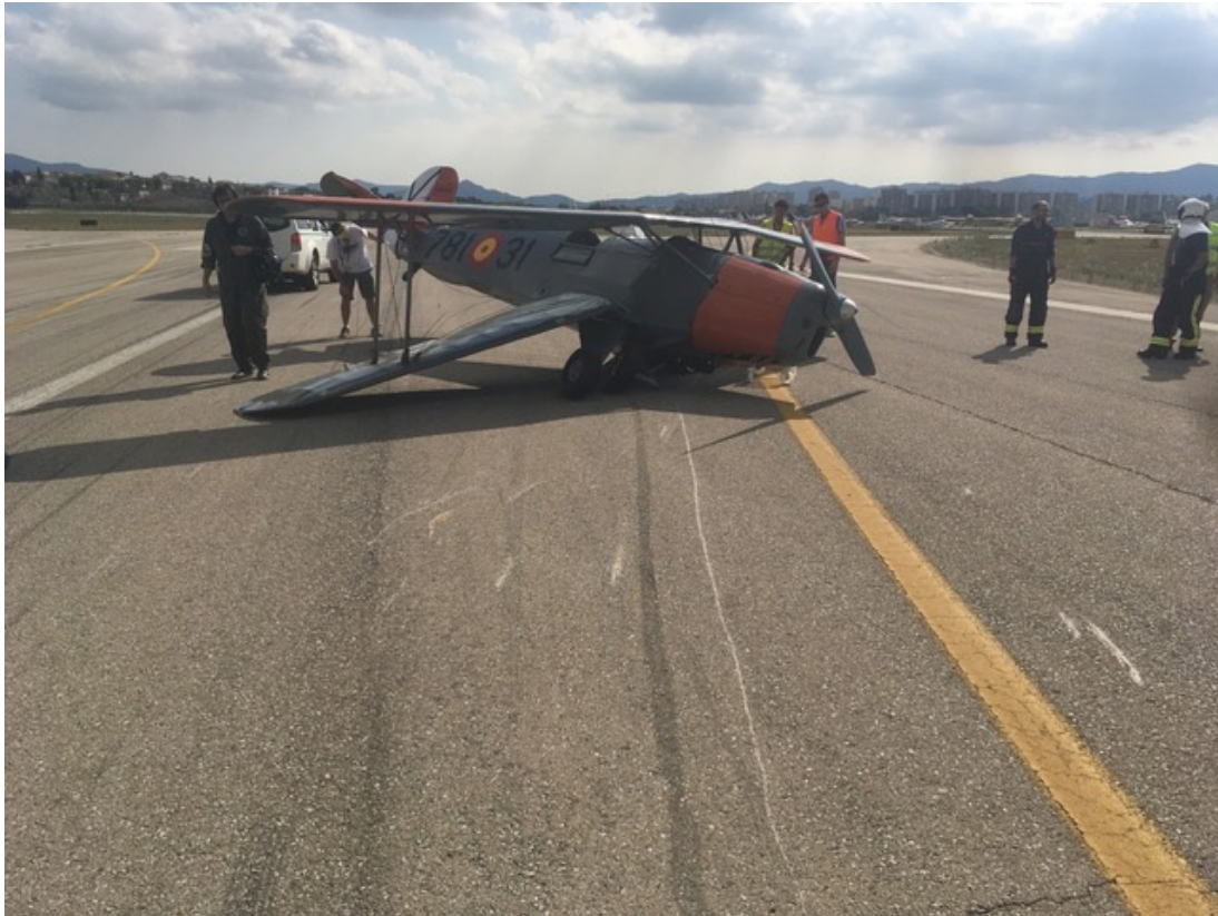
Figura 3. Señales en pavimento