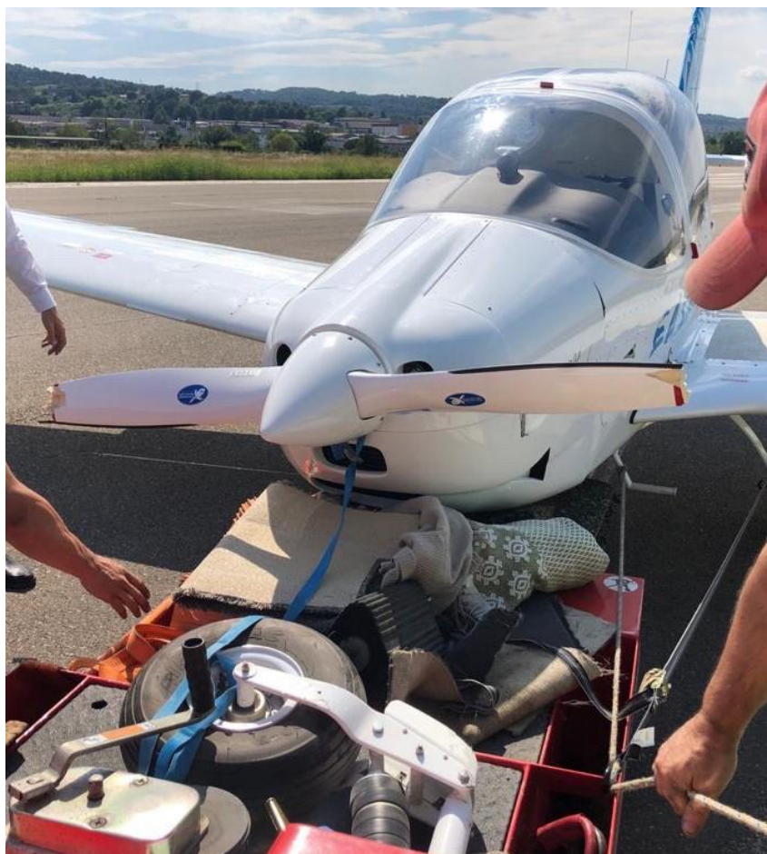
Figura 2: Vista de la aeronave durante su retirada de pista.

Tras el colapso del tren de morro la aeronave sufrió un deslizamiento de aproximadamente 20 metros. La aeronave quedó sobre la pista y fue asegurada de inmediato.