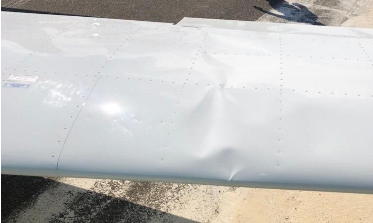
Figura 3:Detalle de los daños en los planos.